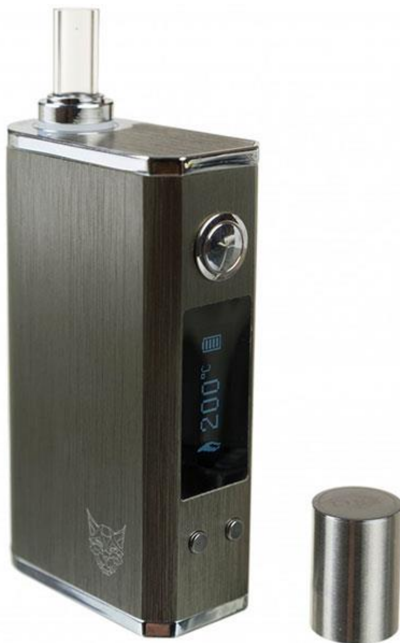
Linx Gaia Vaporizer Steel