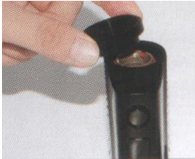
Снятие крышки камеры