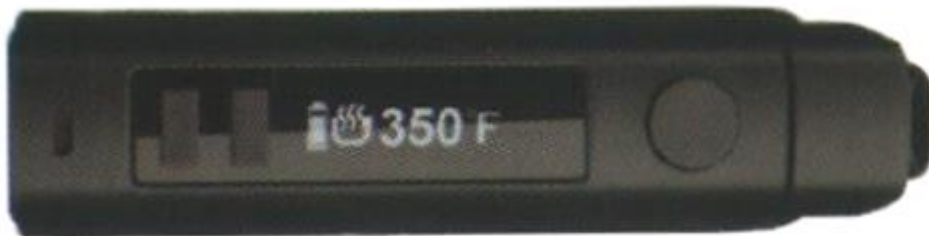
«+» «-» Кнопка управления питанием

Режим дисплея: 0,86 дюймовый дисплей на органических светодиодах с функцией смены ориентации.