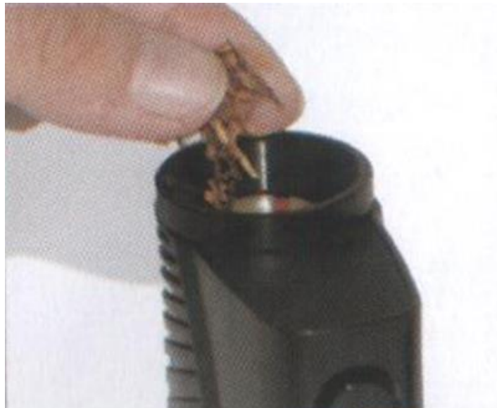
Легкое наполнение камеры