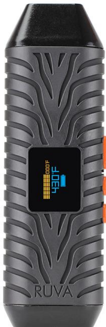
Atmos Ruva Kit Vaporizer